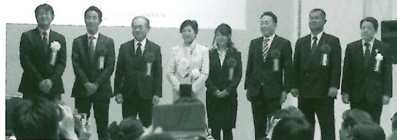
平成29年度 東京ライフ・ワーク・バランス認定企業 認定状授与式

続ける。「中でもすばらしい成果を上げられている企業を認定させていただく。今後はモデルとして取り組んでいただくことで、東京での働き方も変わっていくと確信している。」